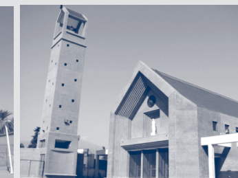
Parroquia Inmaculada Concepción de Colina.