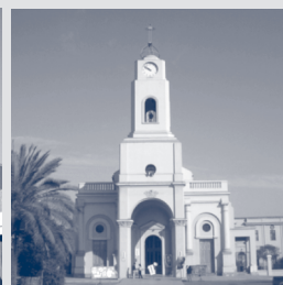
Parroquia-Santuario Inmaculada Concepción, San Ramón.