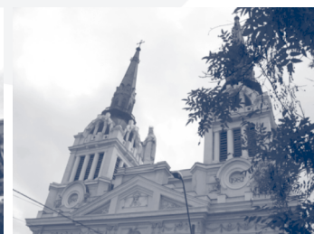
Santuario a María Santísima, Fundación Las Rosas.