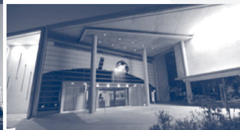
Capilla del Sagrado Corazón, Campus San Joaquín, Universidad Católica de Chile.