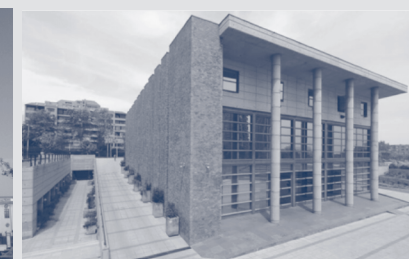
Parroquia Nuestra Señora del Rosario, Las Condes.

Se trata de poner el corazón en contacto con el amor misericordioso y abrirnos a la transformación personal que el provoca, y que nos lleva a vivir nuestro compromiso cristiano de una manera más plena, tanto en nuestra relación con Dios como con nuestro prójimo.