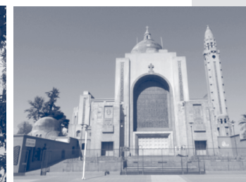
Santuario de Nuestra Señora de Lourdes, Quinta Normal.